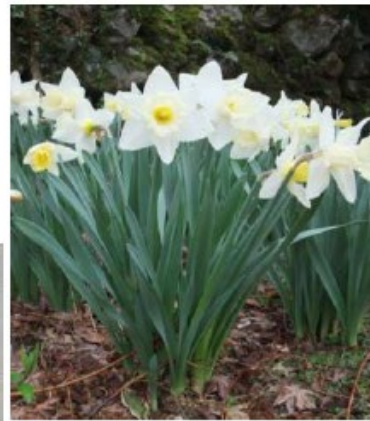
花期：1～4月頃（品種によって異なる）