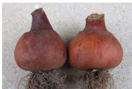
イヌサフランの球根(鱗茎)