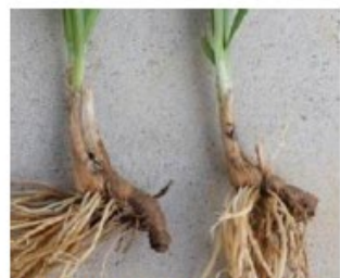
地下部：丸い球根（鱗茎）がない。