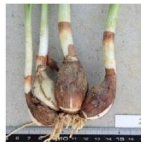
地下部：丸い球根（鱗茎）がある。