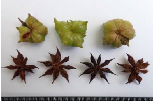
シキミの果実 （中に含まれる種子も有毒）

※果実を香辛料の八角（スターアニス）と間違えることに注意。日本では、八角が成る木は、植物園の温室等で栽培されることはあるが、自生しない（野生のものはない）。