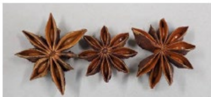
スターアニス(八角) 香辛料(スパイス)として利用される