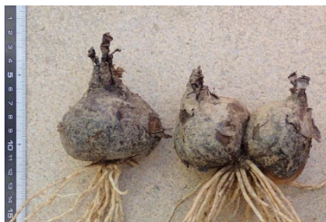
ヒガンバナの球根(鱗茎)