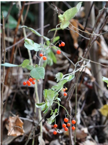
ヒヨドリジョウゴ（ナス科）

ゲンゲ（レンゲソウ）やツツジの蜜を吸った経験のある子どもは、有毒のレンゲツツジを区別できるであろうか？子どもたちに実や蜜を摂取させる経験は、自然と触れ合い、自然の恵みや食べものについて学ぶ手段の1つである。一方で、大人の目の届かないところで誤食事故が発生する危険性についても認識すべきであり、安全の確保を第一に、実施について検討していただきたい。